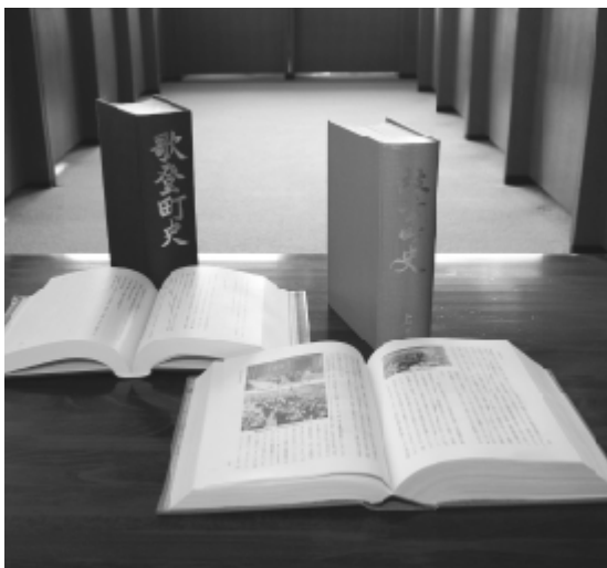
両区の歴史は各々記録され、合併後の歩みは1冊になります。

合併協議会において、旧両町の合併までの歴史を旧町毎に取りまとめ、合併後に刊行する旨決定されており、旧枝幸町では、21年度の刊行を目指して16年度から取り組みを始め、現在も