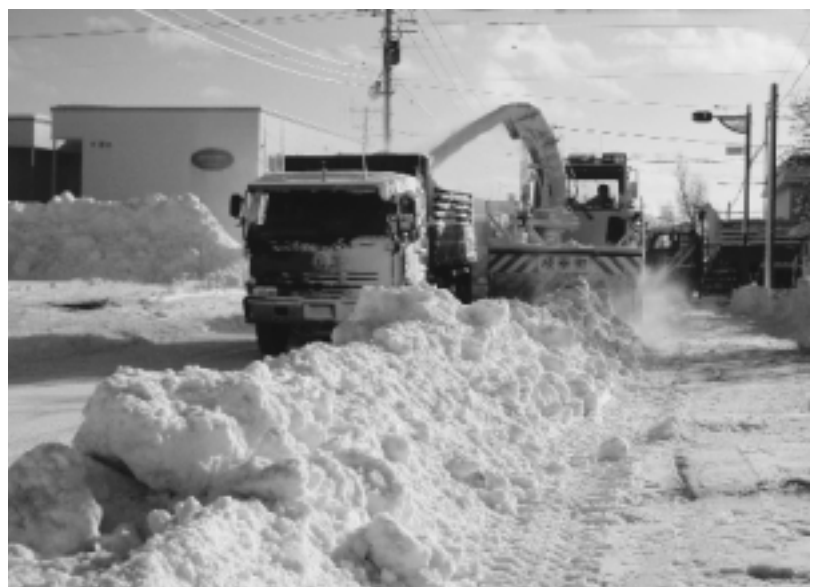
生活道路の確保は万全に