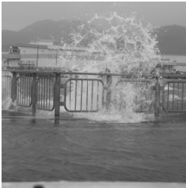
猛威をふるう10月の低気圧

枝幸町の産業形態・人口規模・財政力等を勘案した中での枝幸町の財政規模について、地方自治法によ