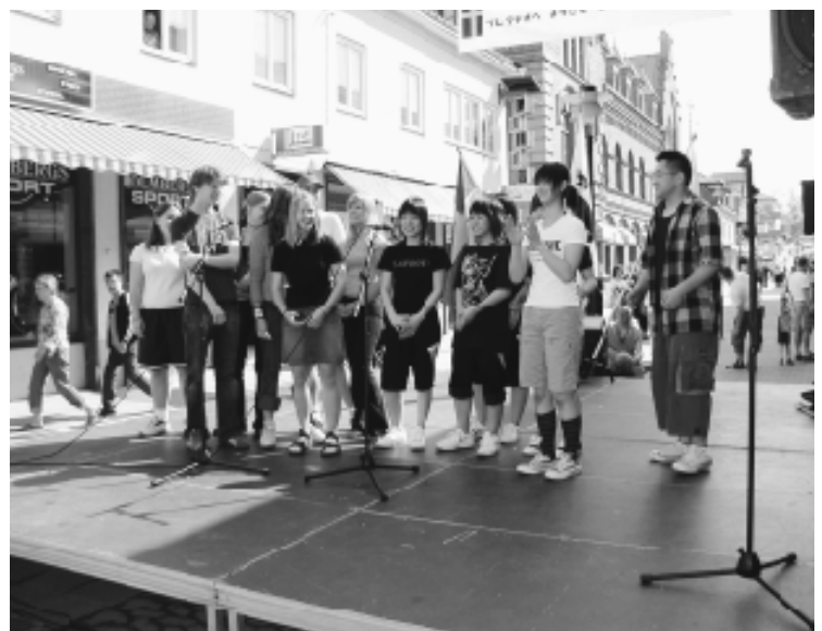
子どもたちの実りある交流を未来へつなごう

品等については、著しく低い価格で落札され支障があったとの報告もなく、正當に納入、または業務遂行されたものと考えていますが、今後極端な低価格での落札が行なわれ、契約内容の適正な履行が確保されないような事態が予想されるときには、何らかの対処も考えたいと思いますが、現状では「最低制限価格」設定の考えはありません。また、「管理業務委託」の最低制限価格との整合性については「設計書」のチェック等、今後とも契約内容の適正な履行を確保するための監督・指導を十分行なう考えていきます。