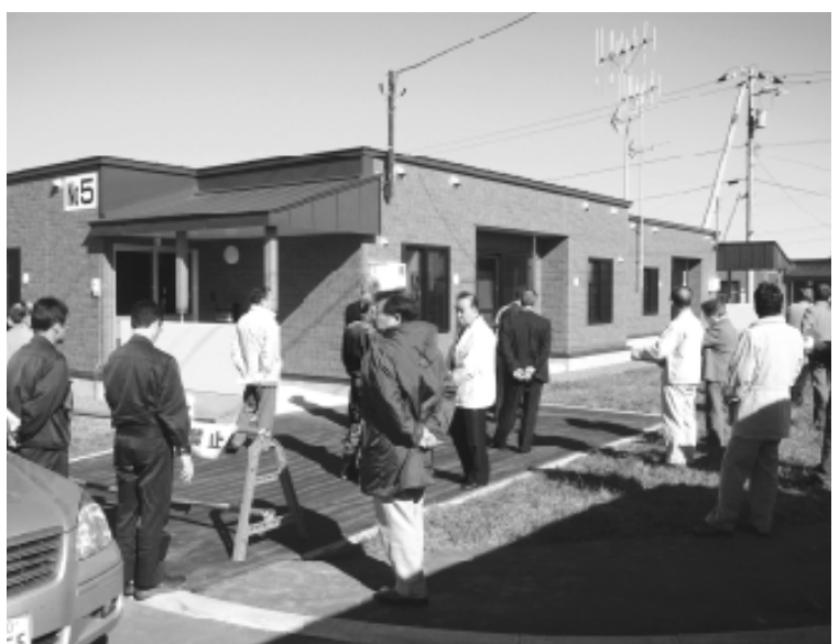
新しく建設された木造外断熱工法の公営住宅（新港団地）