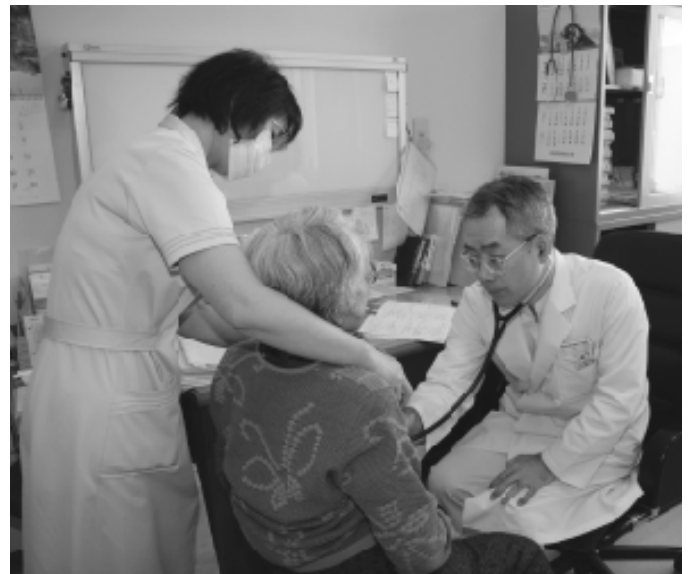
地域医療の充実は住民の願いです（歌登病院）

合併による職場の環境の変化等、又学校ではいじめ問題等で仕事のできない人がいないのか、その事実を