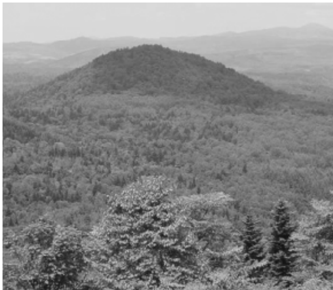
新町の民有林は30,120ha、大切に育てよう町の財産

地域の読書普及の推進と児童の読書の習慣化と機会の提供を図ることを目的として実施され、町内小学校11校526名、中学校4校226名、高校1校118名の応募がありました。本年度は合併の効果もあって多くの応募があり、優秀な作品が多く審査も大変