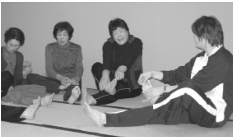
リハビリ医療・理学療法士による指導も行われています