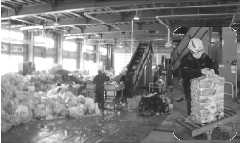
限りある資源を大切にしましょう。(新しく導入されたその他プラ用圧縮梱包機)

報発令時点から災害対策本部解散までの状況説明を受け、災害に対する対応・反省及び今後の課題を踏まえ、早期に防災計画等を策定する旨の報告を受けた。 ・避難所及び避難人員 町関連施設のみ 避難所